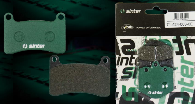
SINTERブレーキパッド比較イメージ